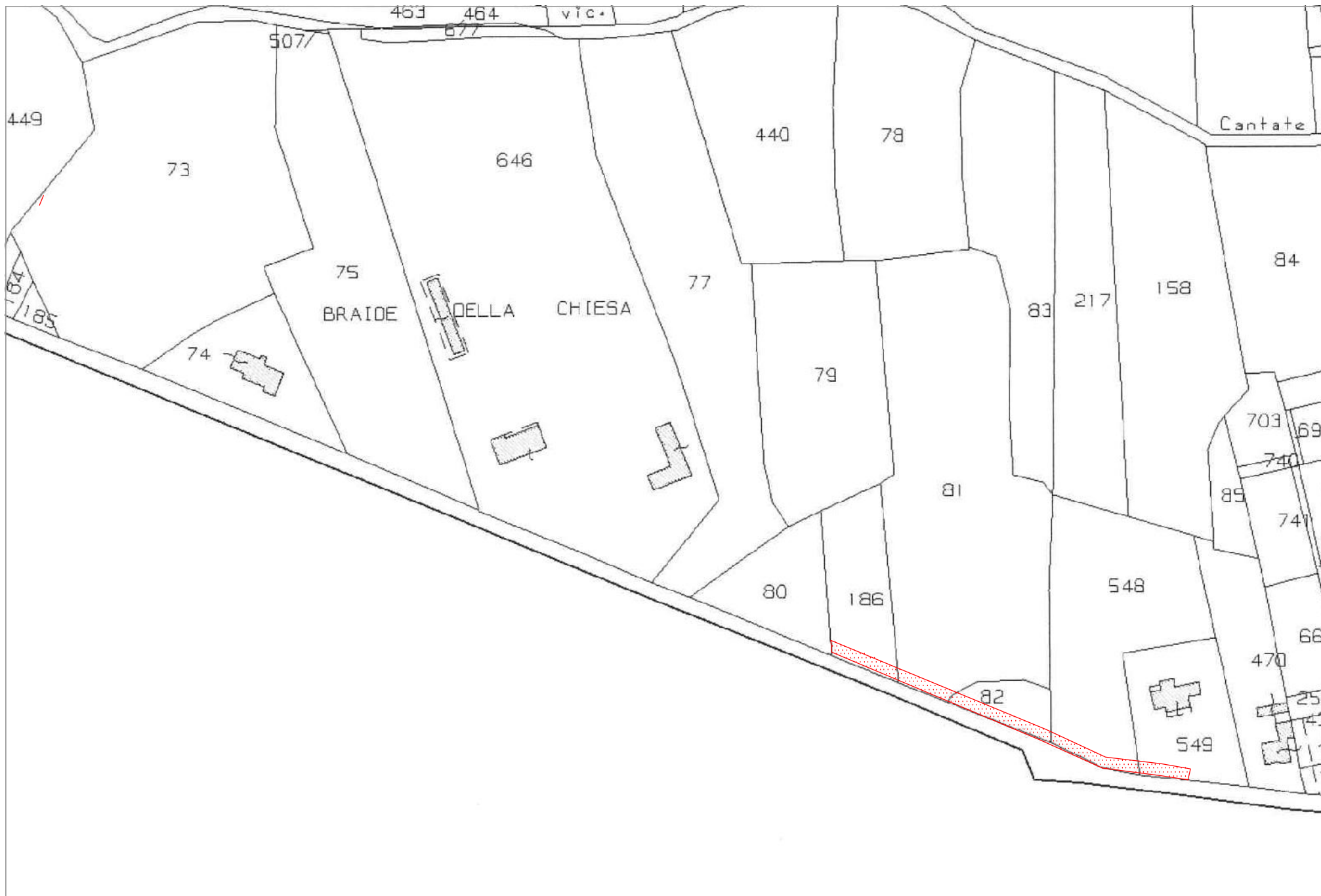
COMUNE DI TEGLIO VENETO - FOGLIO 2 ESTRATTO MAPPA CON DEFINIZIONE DELLE AREE OGGETTO DI ESPROPRIO - Scala 1:2.000